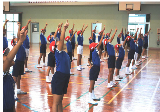
全校ダンスの練習風景

9月になり、早速、授業では運動会の練習が始まりました。朝の校庭では、ランニングでさわやかな汗を流す子どもたちの姿が増えています。先日は、PTA奉仕作業も行われグラウンドも敷地内も整備されました。ご協力ありがとうございました。おかげさまで子どもたちも気持ちよく運動に学習に取り組むことができます。小学校の運動会には、青壮年種目や婦人種目、老人クラブ種目などもあり、まさに「校区の運動会」となっております。お隣近所にも声かけをして、校区民全員で大会を盛り上げていただきたいと思います。